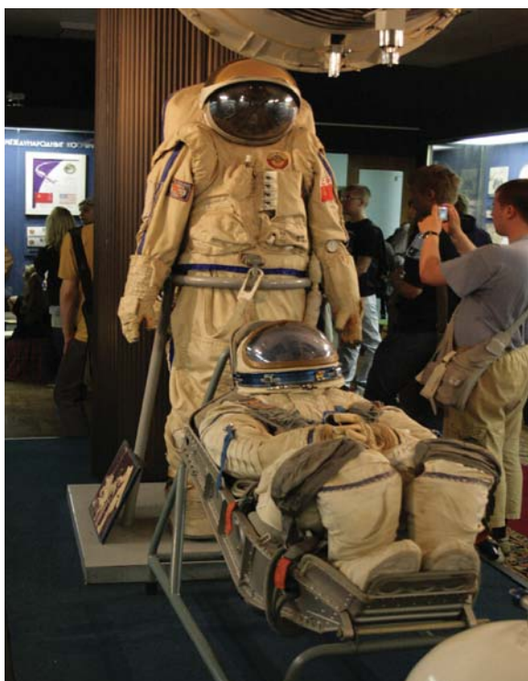
Avaruuspukuja ja muita nähtävyyksiä

Opiskelutahti oli melkoisen tiivis, opetusta oli opiskelulle varattuina päivinä kuusi tai seitsemän tuntia. Luennoilta tuli läksyjäkin mutta ne jäivät useaan otteeseen tekemättä ajanpuutteen ja muiden rientojen vuoksi. Iltaisin oli mahdollisuus käydä ostoksilla läheisessä kauppakeskuksessa ja pelata kaikeilaisia pallopelejä yliopiston urheilutiloissa.