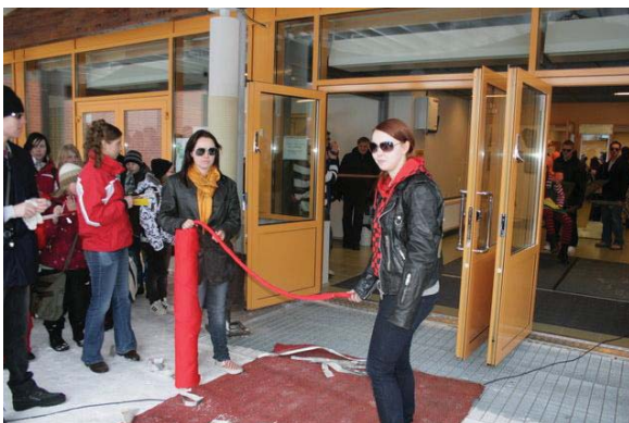
Abeja kohdeltiin Paltamossa kuin julkiksia