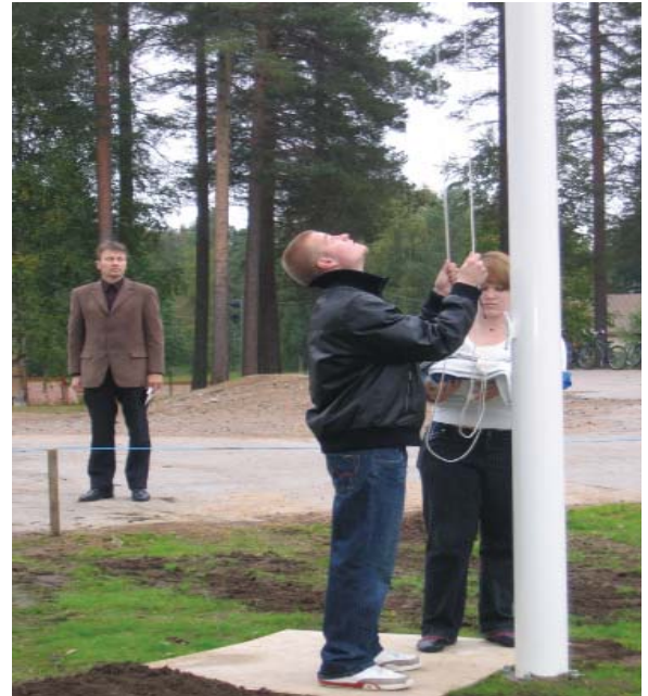
Lipunnostajat ja taustalla puhuja

van, ja muutamat paltamolaiset opiskelijat tarttuivatkin tilaisuuteen nähdä Suomen historian merkittävimmistä hetkistä kertova elokuva.