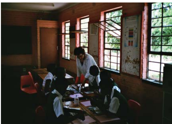
Suvi ohjaa askartelua

Oppilaat tulevat kävellen tai busseilla 7:km säteeltä kouluun, ja turvallisuussyistä heitä neuvotaan tulemaan ryhmissä tai isompien siskosten kanssa. Koulu on ympäröity aidalla, jonka päällä on piikkilankaa. Suljettavan portin kautta päästään piha-alueelle. Koulun ikkunoissa ja ovissa on kalterit, koska varkaudet ovat yleisiä.