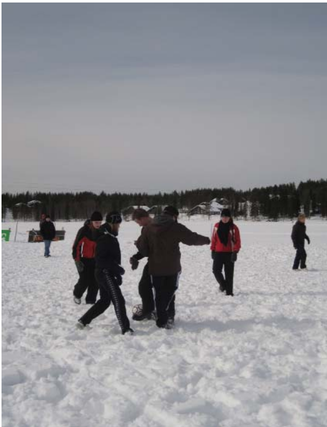
Lumi lensi ja meno oli hurjaa pelikentällä, kun lukiolaiset pelasivat yhdessä umpihankifutista!