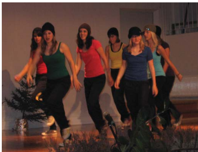
Saksalaisten mukaansa tempaava esitys