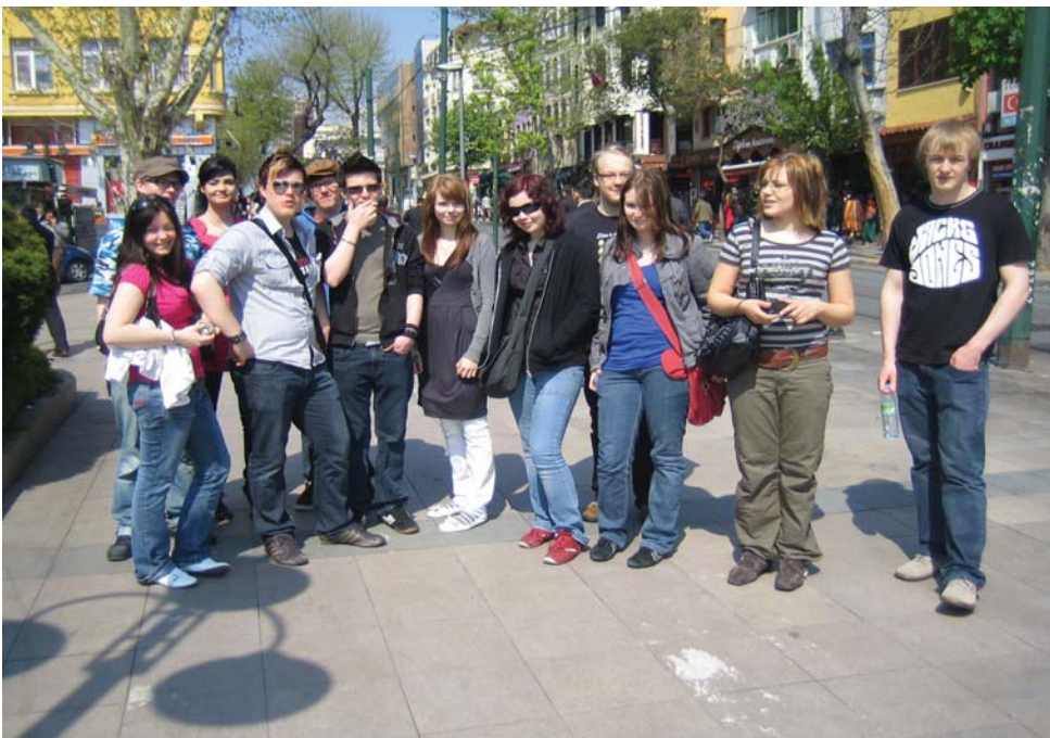
Ensimmäisenä aamuna lähdimme Hagia Sofiaan auringon lämmittäessä kalpeita poskiamme