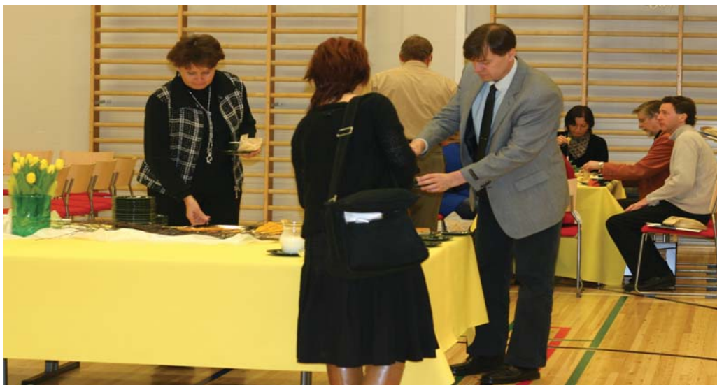
Ruokailu ja kahvittelu oli järjestetty Paltamossa osanottajien mielestä erinomaisesti