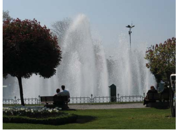
Rakkautta ihmeellisessä Istanbulissa. Turkkilaiset ovat ystävällisiä, mutta tulevat kauhean lähelle, Huuuii! Pelotti.

Viidentenä päivänä palasimme onnellisina ja tyytyväisinä kotiin Hyrylle. Kaikki sairastuimme ainakin lievästi sikainfluenssaan, ei kun kaukokaipuuseen.