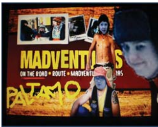
Paltamossa oli seiskaviikolla mitä erikoisinta ohjelmaa

Vanhojen tanssit olivat elämys kaikin puolin. Ainoa huono puoli on se, että ne ovat vain kerran elämässä.