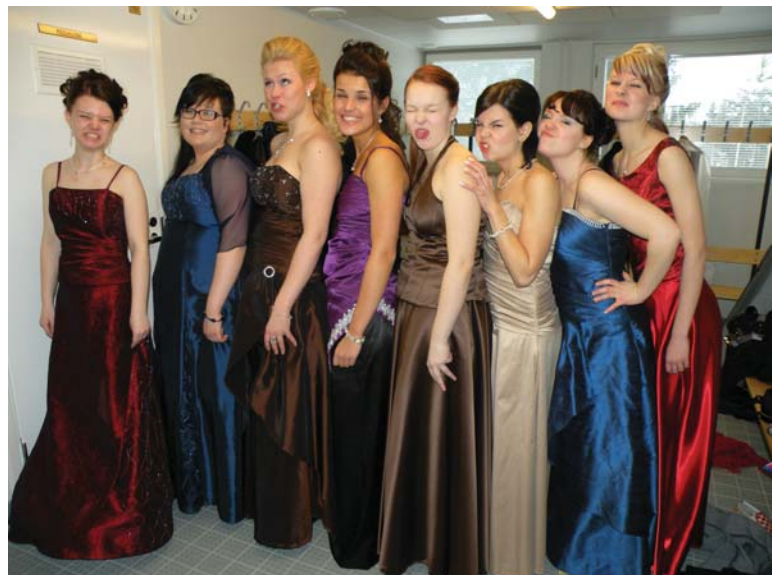
Paltamon tytöt edustuskunnossa