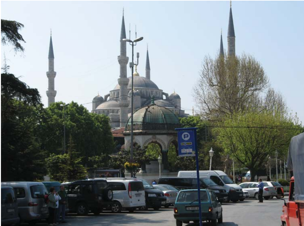
Hagia Sofia on valtavan kokoinen, keskiaikainen moskeija. Näimme siellä kissan ja bysanttilaista arkkitehtuuria.