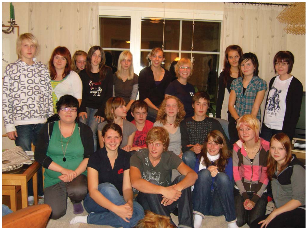
Vierailijat ja isännät