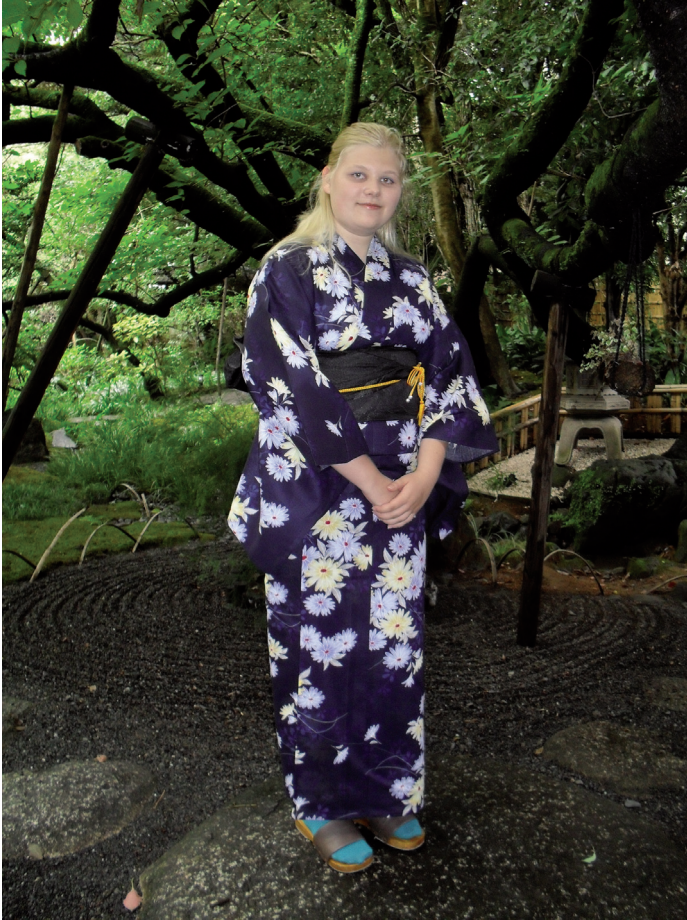
Perinteinen Japanilainen asu, kimono.

Lähdin Japaniin Paltamosta vuoden 2010 syksyllä ja ehdin olla Japanissa noin seitsemän kuukautta. Joiduin palaamaan Suomeen noin kolme kuukautta etuajassa Japanin tsunamin jälkeisen tilanteen vuoksi, mutta vaihto-oppilasvuoteni oli kerrassaan mahtava kokemus. Olin opiskellut japania Suomessa noin kaksi vuotta ennen Japaniin menoa, mutta ei siitä ollut paljon hyötyä. Opin kuitenkin nopeasti japania, koska isäntäperheeni ei osannut englantia, joten kommunikointi onnistui vain japanin kielellä ja elekielellä.