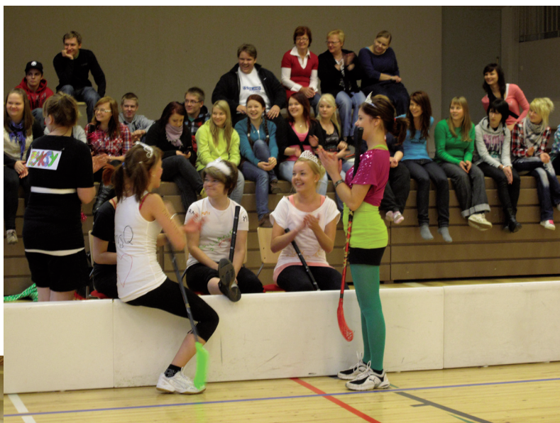
Tiramisut voittivat parhaiden asujen palkinnon.