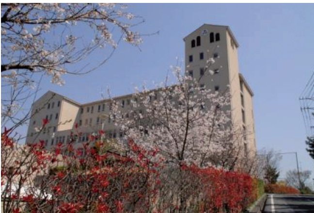
Seirei Christopher High School, koulu jossa opiskelin Japanissa ollessani.

Olin ensimmäiset päiväni Japanissa valmennusleirillä, jonka jälkeen siirryin ensimmäiseen isäntäperheeseen Shizuokaan. Olin siinä isäntäperheessä noin viikon, jonka jälkeen siirryin