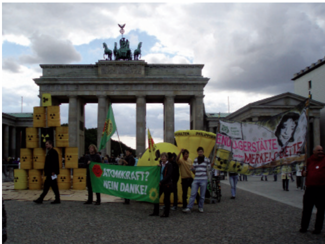
Ydinvoiman vastainen kampanja Brandenburgin portilla

Matka sujui hyvin ilman ongelmia. Yhtenä päivänä katosi