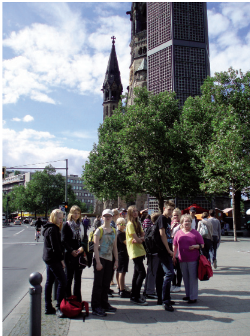
Sodan muistomerkki Kaiser Wilhelm Gedächtniskirche