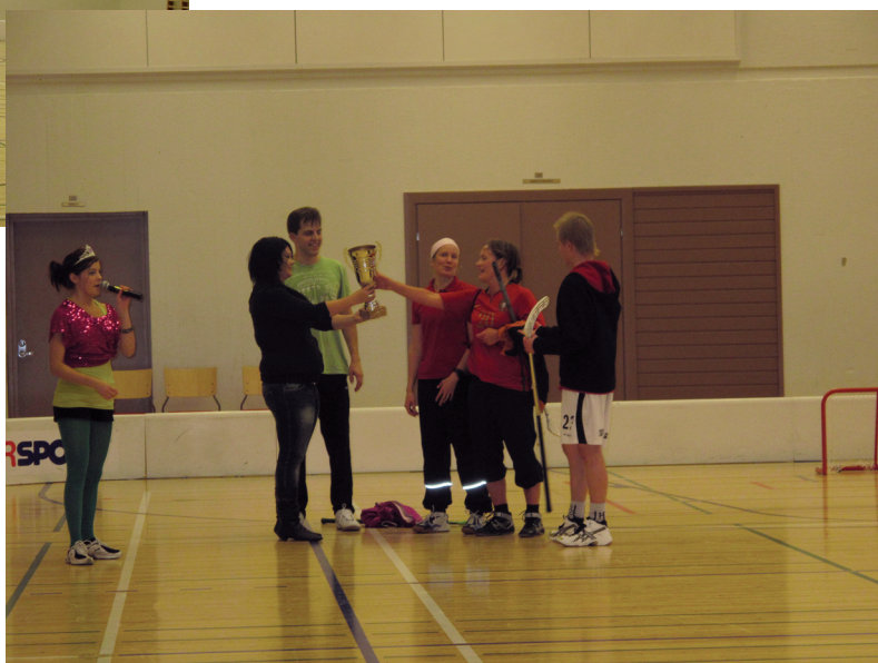
Opettajat saivat upean pokaalin voittaessaan turnauksen, toiseksi tulleet P-Pojat kokivat karvaan tappion.