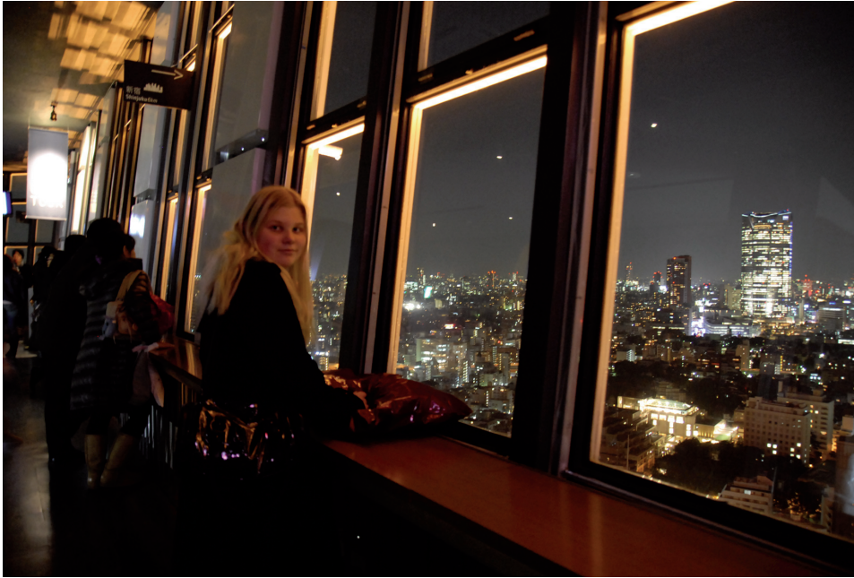
Kuva: Tokyo Towerin sisältä näkee hyvin kaupunkimaisemaa.

nukkumassa, joten en ollut huomannut sitä. Katsoessani televisiota yllätyin, miten suuresta järityksestä oli kysymys, nimittäin melkein koko Japanin rannikolle oli annettu tsunamivaroitus, ja jälkijärityksen jälkeen varoitus annettiin koko Japanin rannikolle. Uutisia katsellessani ajattelin, että kyllä nyt vanhempani Suomessa ovat huolissaan, ja ei aikaakaan, kun puhelimeni alkoi soida ja soittajahan oli tietenkin äiti Paltamosta. Asuin Hamamatsussa, joka on rannikkokaupunki, mutta asuin noin tunnin päässä rannikolta. Hamamatsuunkin tuli tsunami vaikkakin vain 80-senttinen.